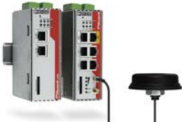
Abbildung 16: mGuard Router