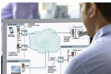
Abbildung 19: Kundenapplikation mit mGuard Secure Cloud