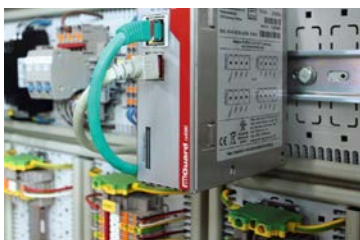
Abbildung 18: Montagebeispiel Schaltschrank